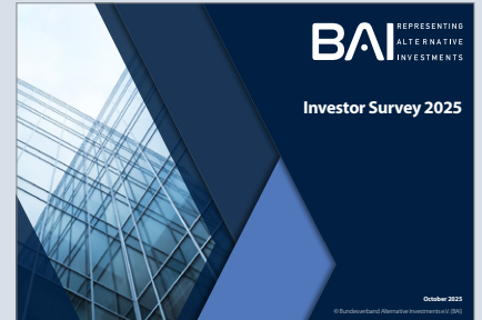
Investor Survey 2025 Titelseite

steigt die Zahl der Marktteilnehmer. Und ein Thema, das bis vor Kurzem tabu war, rückt auf die Agenda: Defence-Investments. Rund ein Viertel der Befragten hält diese bereits für einen Megatrend – viele weitere diskutieren Investitionen in Dual-Use-Technologien oder Verteidigungsinfrastruktur.